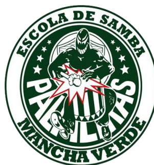
Figura 2 – Mancha Verde do Palmeiras.