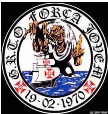
Figura 1 - Força Jovem do Vasco.

Esses atributos masculinos estão enunciados nos símbolos e marcas distintivas das torcidas, em seus gritos e cânticos e em outras formas de linguagem desses agrupamentos. Quase toda torcida organizada surgida na virada da década de 1960 para 1970 possui um mascote, uma figura que representa esteticamente a torcida em bandeiras, faixas e outros materiais. Por exemplo, a Força Jovem do Vasco tem como mascote o personagem Eddie , símbolo da banda britânica Iron Maiden . A torcida Mancha Verde, do Palmeiras, adotou o vilão da Disney Mancha Negra. A Torcida Jovem do Flamengo tem como principal símbolo um tanque de guerra. A Gaviões da Fiel incorporou a ave predadora que dá nome ao grupo.