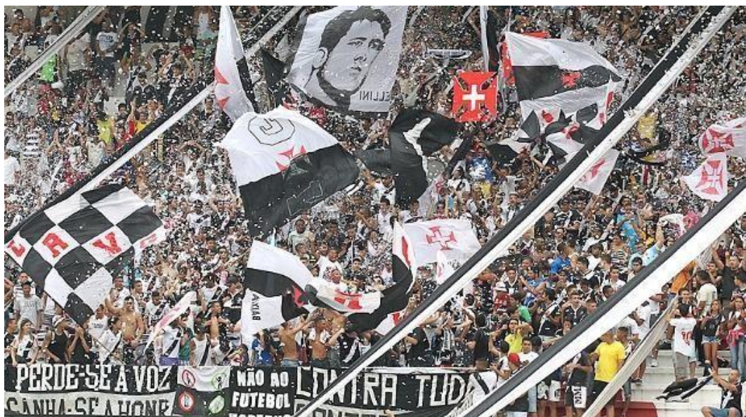
Figura 6 – A GDA no Estádio de São Januário.

história do clube ou aludindo a um bairro ou região onde a torcida se faz presente. As imagens abaixo dão um pouco a noção da identidade visual da torcida: