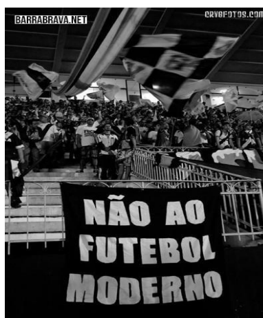
Figura 9 - Faixa em São Januário