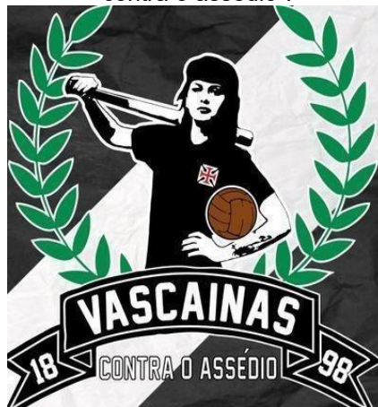
Figura 12 – Símbolo do coletivo “Vascaínas contra o assédio”.