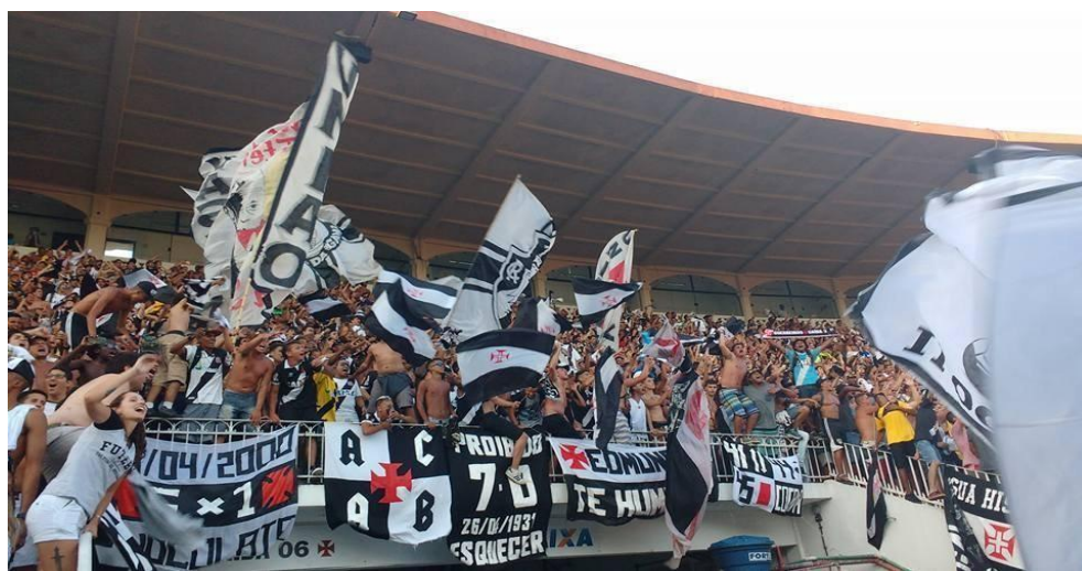
Figura 7 – Trapos e bandeiras da GDA.

Com o tempo, a torcida também passou a adotar as bandeiras de mastro das torcidas organizadas tradicionais. Contudo, independente do formato de seus materiais, os padrões estéticos adotados nos materiais da GDA obedecem a uma outra lógica. Embora tenha seu próprio logotipo, este dificilmente está estampado nas bandeiras e faixas da torcida. Ao invés disso, optam por usar os símbolos e cores do clube e exaltar ídolos e façanhas do passado.