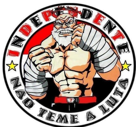
Figura 5 - Torcida Tricolor Independente.

Como relata Toledo (1996), esses símbolos remetem à esfera do incontrolável, do imprevisível, do indomável, características dignas de serem cultivadas pelos integrantes da torcida, sobretudo no que diz respeito à defesa da honra e reputação do grupo. Mesmo aquelas torcidas que possuem símbolos mais “dóceis”, como o casaca Tricolor Independente, que adota um anjo como mascote (é o mascote oficial do São Paulo Futebol Clube), fazem questão de estilizá-lo, o colocando como um personagem musculoso, intimidador e que “não teme a luta”.