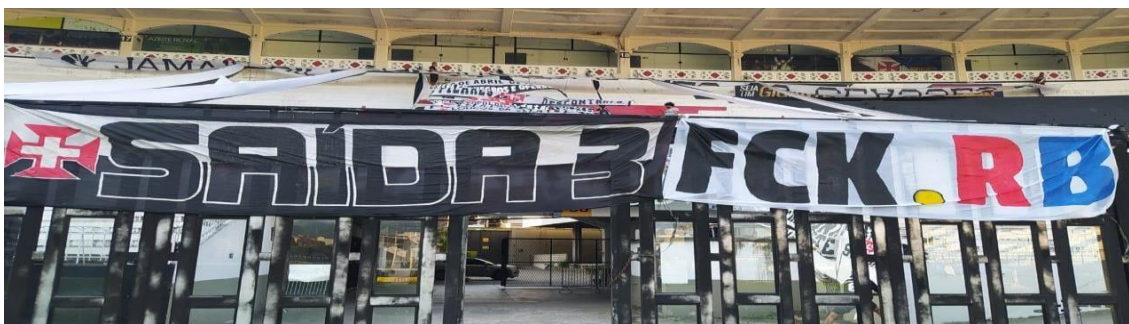
Figura 10 - Faixa contra a empresa Red Bull.