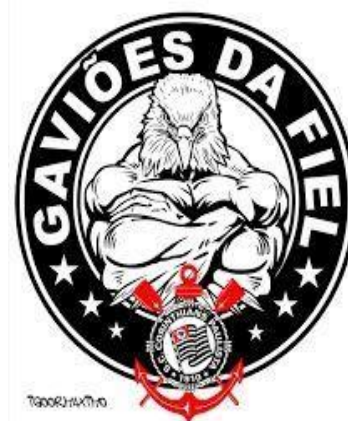
Figura 4 – Torcida Gaviões da Fiel