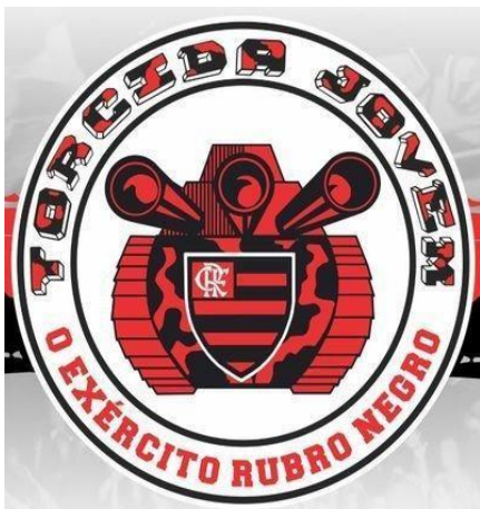
Figura 3 - Torcida Jovem do Flamengo