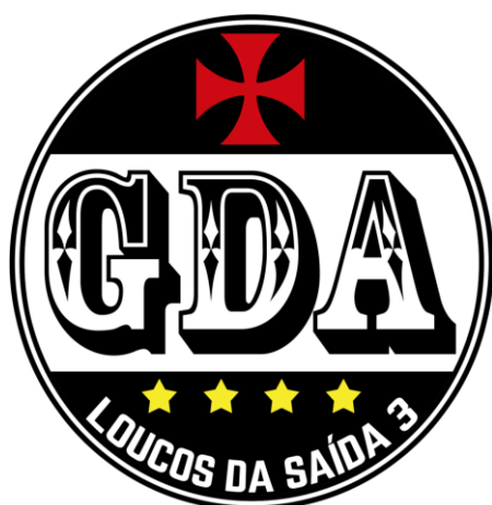
Figura 8 - Logotipo da GDA

Hoje, com a internet, há vários espaços virtuais que repercutem protestos e manifestações de torcidas mundo afora contra este “outro” a ser combatido que é o “futebol moderno”. O acesso a essas informações leva os membros da GDA a dialogarem com essas pautas e bandeiras, como ficou explícito em uma faixa contra a empresa transnacional de bebidas Red Bull 98 colocada no jogo contra o RB Bragantino, time brasileiro comprado pela companhia. Com os dizeres “ Fuck RB ”, a torcida emula um padrão internacional de protesto contra a empresa, que possui clubes na Alemanha, Áustria, Estados Unidos e Brasil.